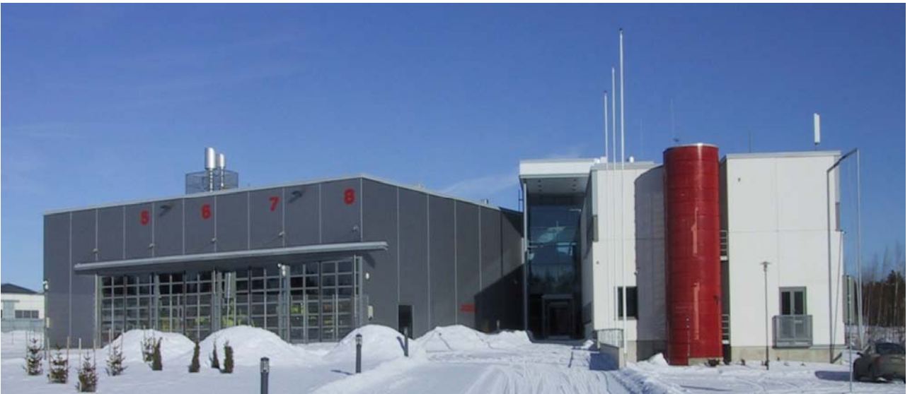
YHTEISPELASTUSASEMA, Helsinki-Vantaan lentoasema, 6800 m 2 br, 2003, SR