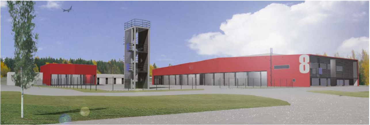
HYVINKÄÄN PALLOASEMA, Hyvinkää, U, 2700 m 2 ka, 2009, SR