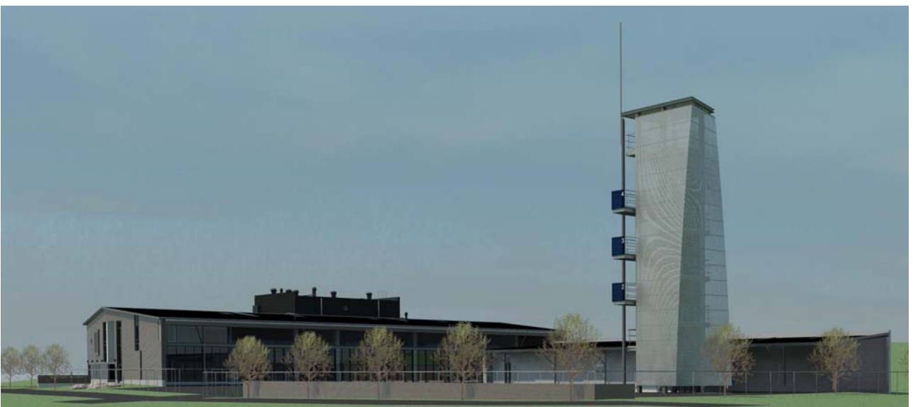
HAVUKOSKEN PALLOASEMA, Vantaa, 2291 kem 2 , rakenteilla, TP