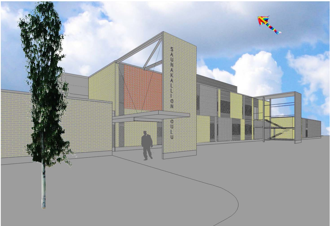
SAUNAKALLION KOULU, JÄRVENPÄÄ